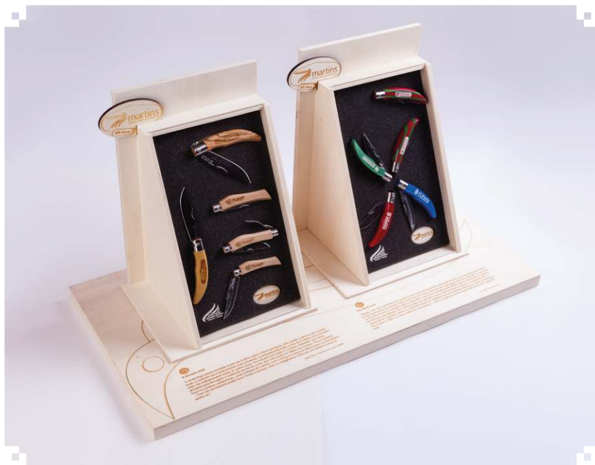
Display DUPLO com proteção em acrílico.