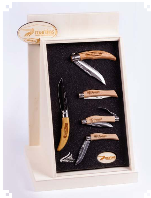
Display SIMPLES com proteção em acrílico.