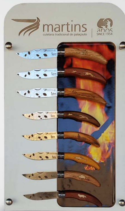
Display vertical [8 navalhas] com proteção em acrílico.