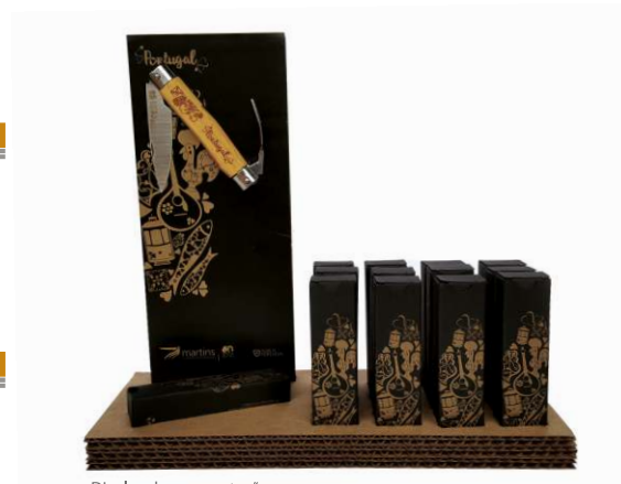
Display de apresentação