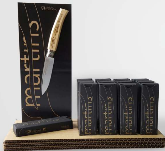
Display [12 navalhas] com caixa em cartolina.